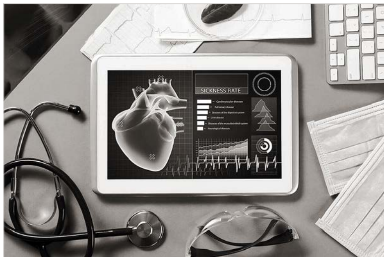
Развитие цифровых технологий в медицине ускорилось за время пандемии.

Принято считать, что творчество присуще только человеку, а машина этого не умеет, она способна лишь выполнять функции, на которые запрограммирована. Так вот искусственный интеллект умеет генерировать идеи, решать