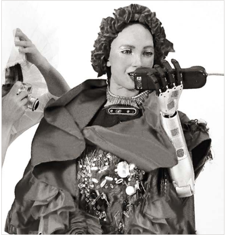
Робот с искусственным интеллектом София примеряет на себя роль бьюти-блогера.