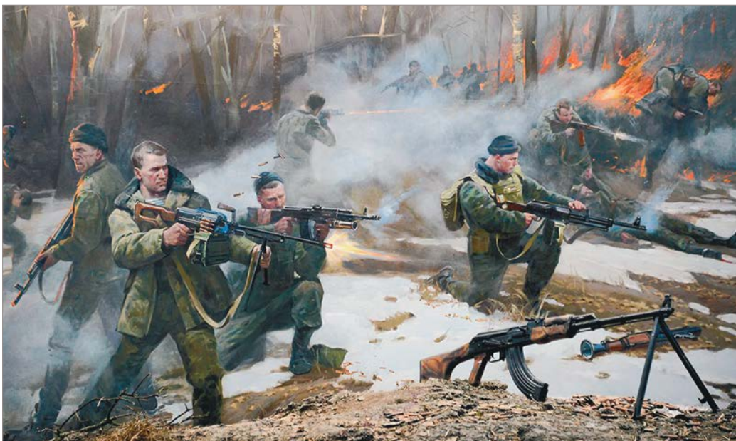
Подвиг 6-й роты запечатлен в живописи.