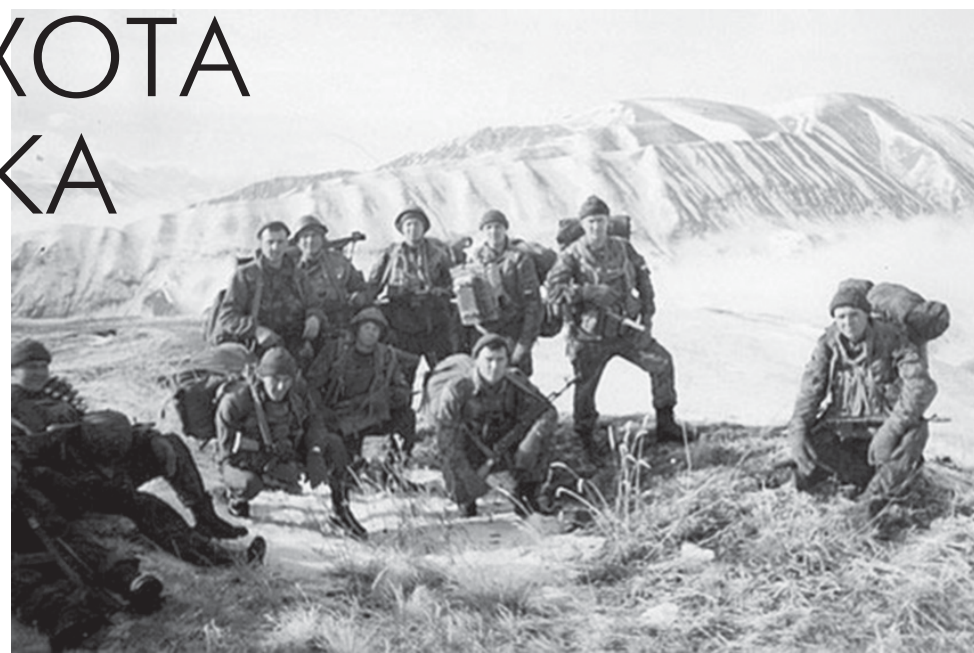
Все еще живы.

Именно один на один. Это в районе, где федеральных частей было не просто много, а очень много. Да, впоследствии объясняли, что авиация не работала из-за тумана, а другие части не могли подойти из-за разлива горных рек. Но вот майор