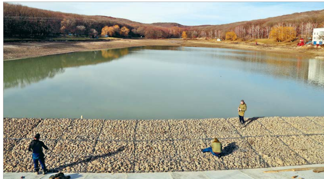
Так сейчас выглядит Комсомольский пруд.