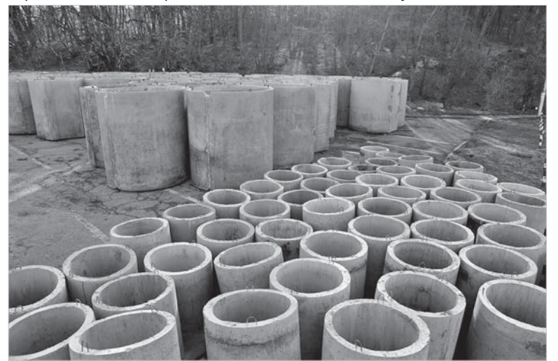
Гидротехническому сооружению предстоит капитальный ремонт.