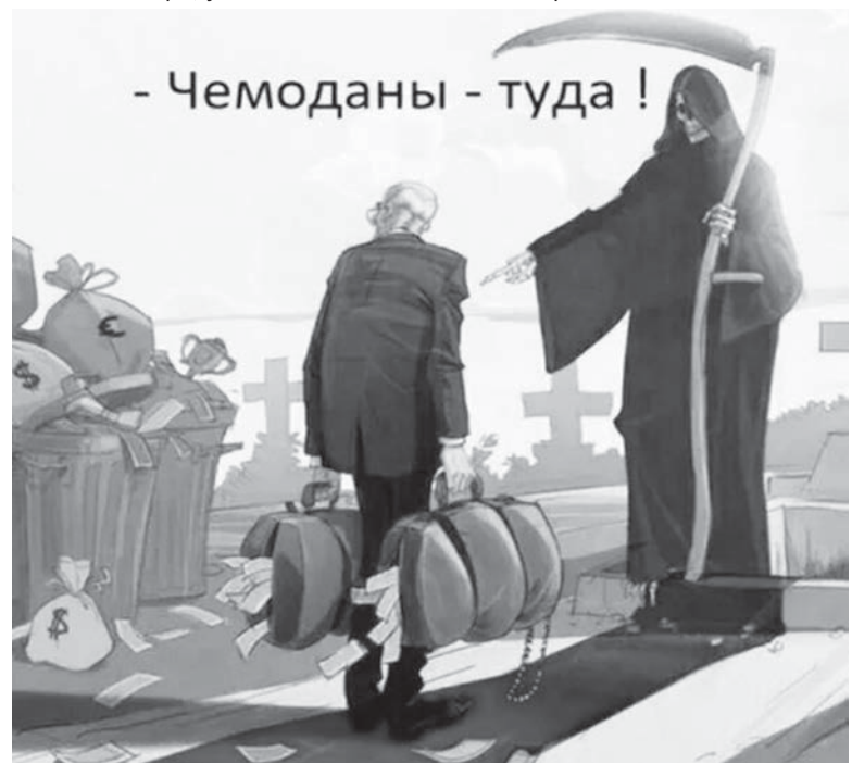
- Чемоданы - туда !