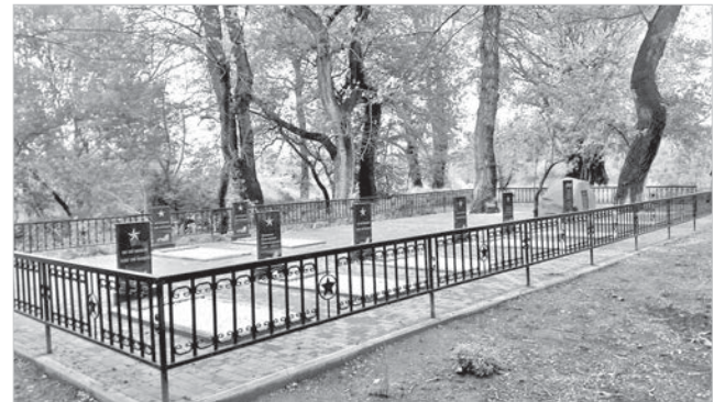
Братская могила в Невинномысске. с.с. Киевка Апанасенковского района, с.с. Покойном Буденновского района, с.с. Крымгиреевка и поселке Новом Янкуле Андроповского района, ауле Новкус-Артезиан Нефтекумского горокруга.

Братские могилы отремонтировали в Невинномысске,