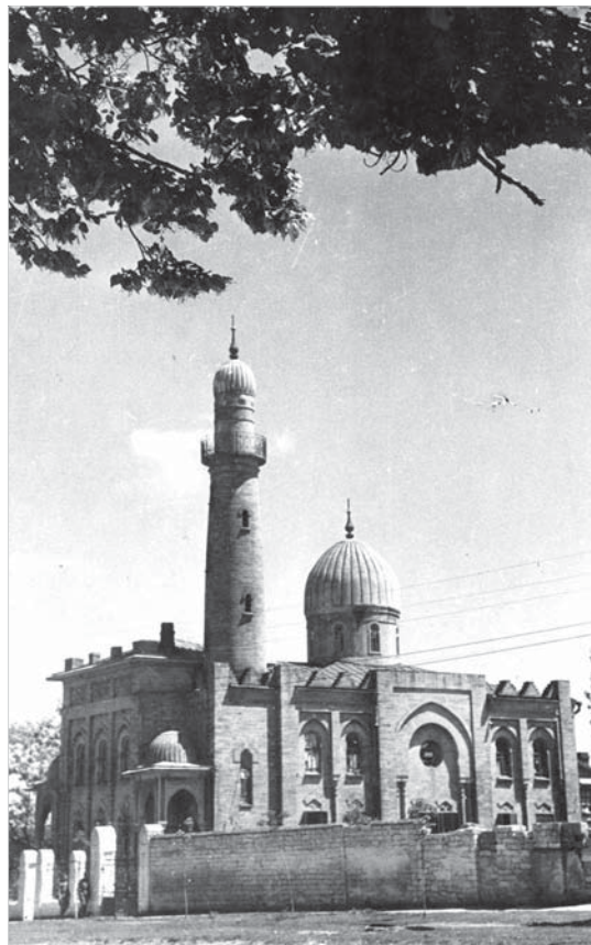
В 1965 году в этом здании находилось одно из архивохранилищ.