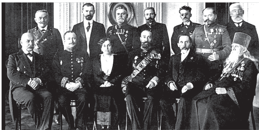
Ставропольская ученая архивная комиссия 4 октября 1915 года (кадр из кинохроники). Третий справа в первом ряду – Ставропольский губернатор Б.М. Янушевич, второй – председатель комиссии Г.Н. Прозрителев.

К середине XX века архивы учреждений были переполнены. Поэтому сохранялись главным образом лишь те документы, которые представляли практическое значение. Они находились в подвальных, непригодных помещениях, в том числе сырых помещениях, часто плесневели, гнили, повреждались грызунами. В результате гибли ценные источники по истории края. Нередко документы использовались для переплета книг, оклейки стен и даже в качестве оберточной бумаги.