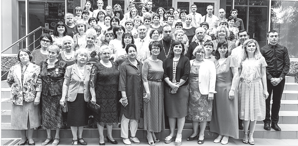
Комитет Ставропольского края по делам архивов, сотрудники Государственного архива Ставропольского края и ветераны архивной службы. 2018 год.