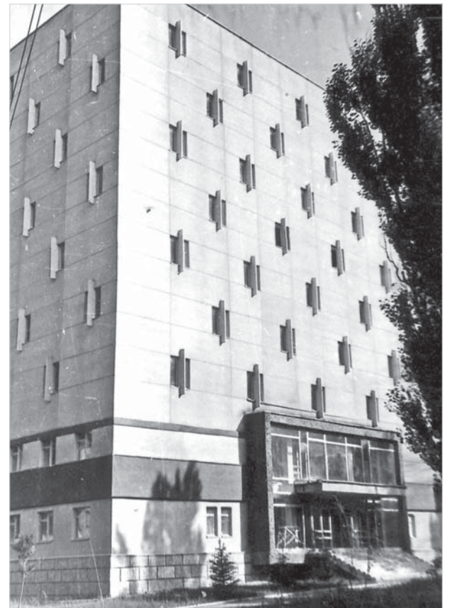
Здание краевого государственного архива на улице Ломоносова, 12. Снимок 1979 года.