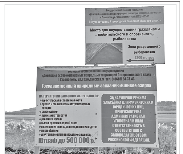
Не так давно здесь ловили рыбу.

«Для оценки состояния водоема были привлечены специалисты Всероссийского научно-исследовательского института рыбного хозяйства и океанографии. По заключению ученых периодическое пересыхание озера – это его естественная гидрологическая особенность, не связанная с антропогенным воздействием», – отметили в ведомстве.