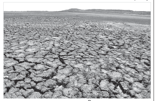
Высохшее дно озера.