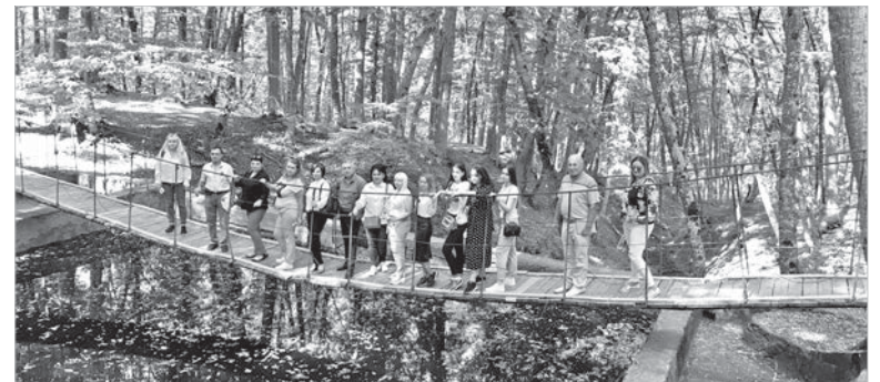
На Большом Холодном роднике.