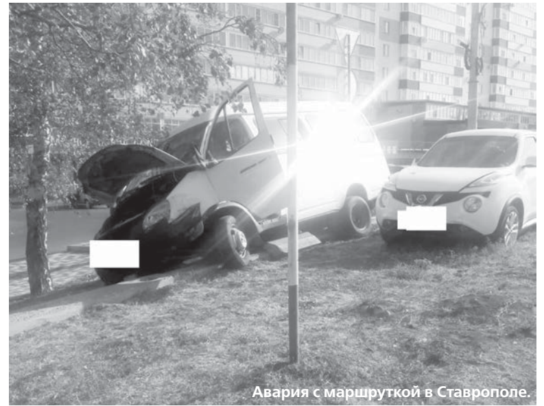
Авария с маршруткой в Ставрополе.

Если же водитель уверен, что царапина на зеркале второй машины уже была, необходимо требовать проведения экспертизы и своего авто тоже - на предмет совпадения повреждений.