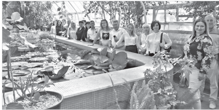
В зимнем саду.

Так называемый регулярный, или английский, парк на сегодняшний день включает 13 аллей – липовые, лиственничные, бере-