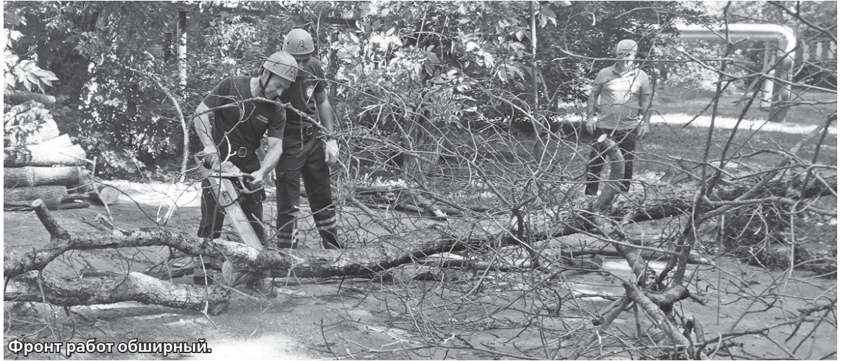
Фронт работ обширный.

Важнейший субботник провели у школ, рядом с которыми сложилась опасная ситуация: у лица №15 высохшие ветви на-