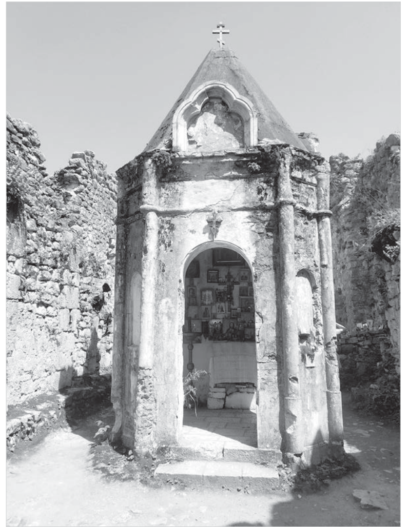
Часовня Иверской Божией Матери.