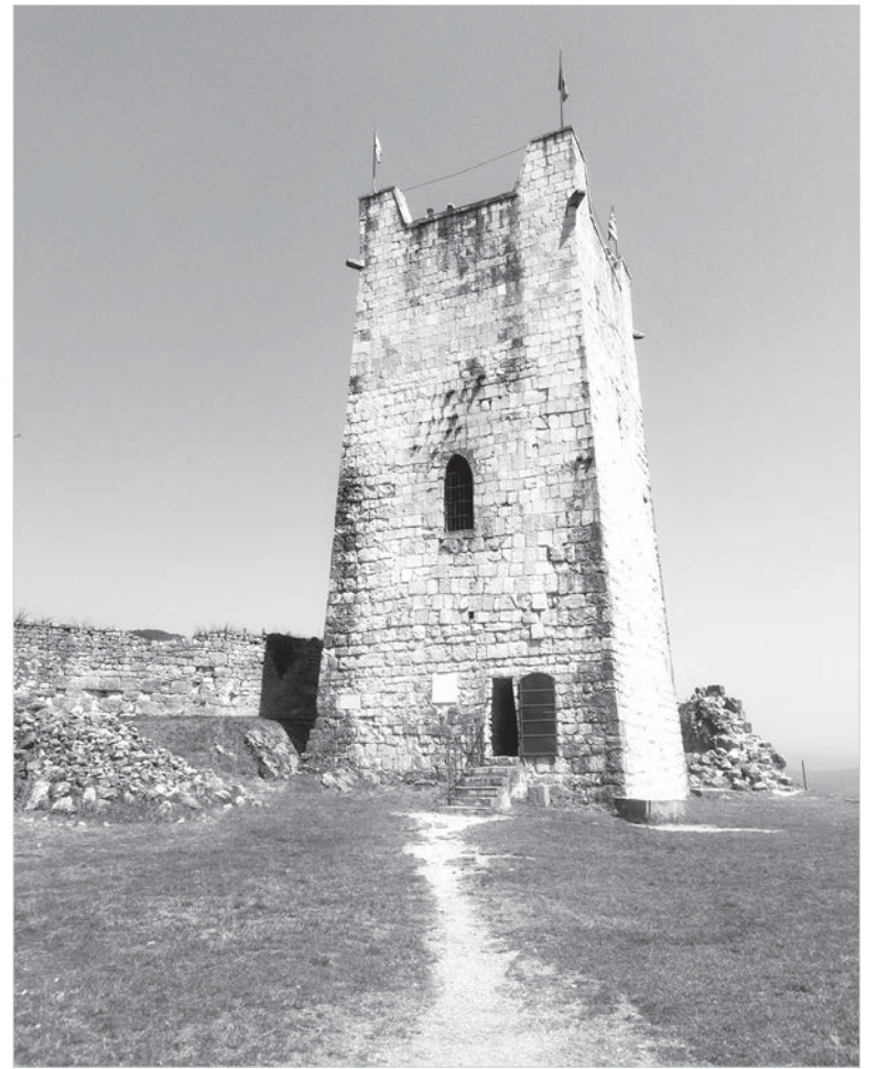
Главная башня Анакопийской крепости.