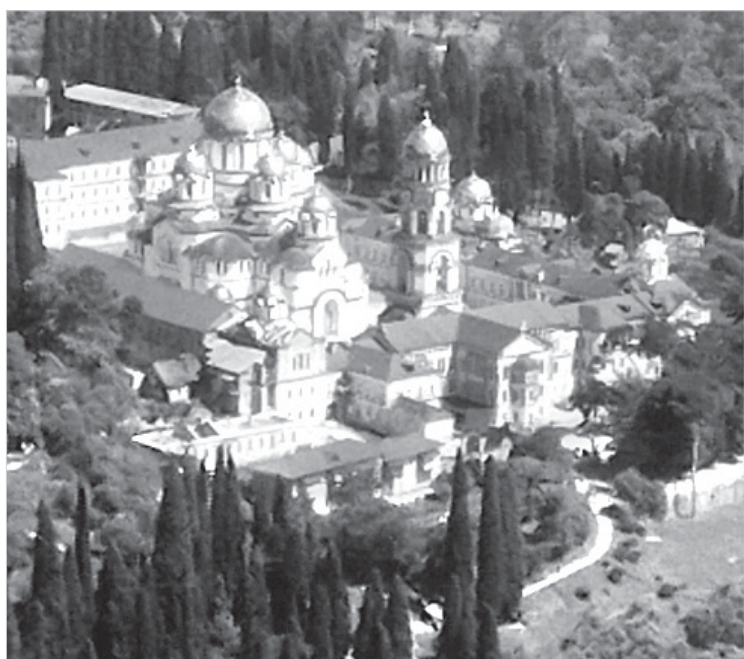
Вид на Новоафонский монастырь Симона Кананита.