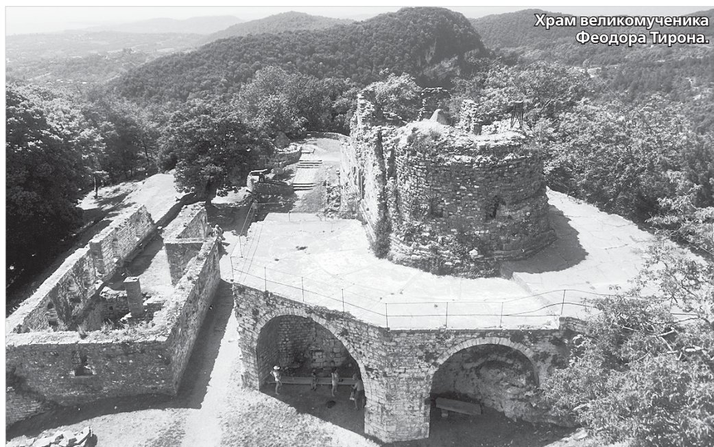
Храм великомученика Феодора Тирона.

Анакопийская, она же Апсарская, она же Иверская гора находится в Новом Афоне. Путаница с названием объясняется просто: Апсарская гора – название историческое, Анакопийская – по названию крепости и города, а Иверской ее назвали после того, как монахи,