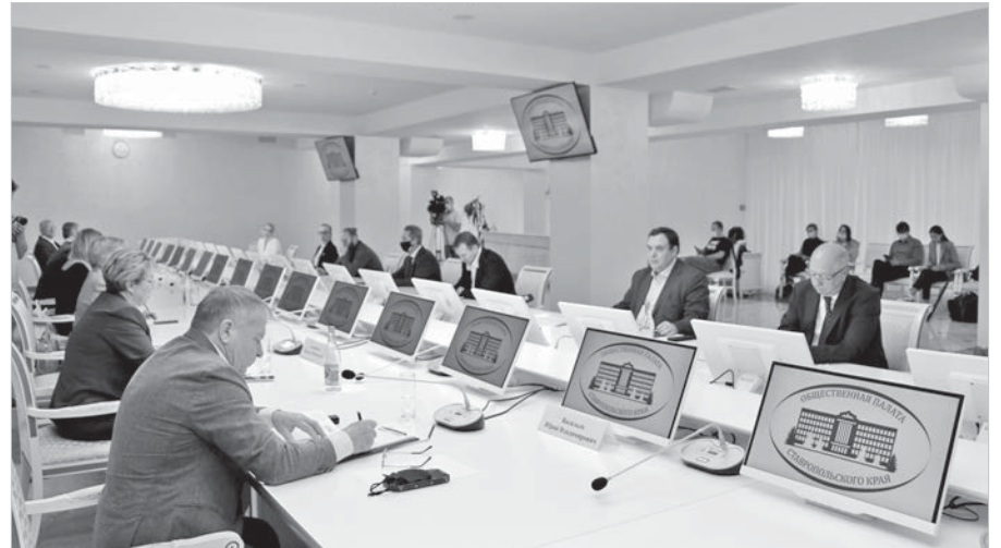
В Ставрополе обсудили готовность региона к предстоящим выборам.

Согласно российскому законодательству граждане, содержащиеся в местах лишения свободы по приговору суда, ограничены в избирательных правах. Вместе с тем большое количество наших соотечественников, не лишенных избирательного права, не могут прийти на избирательные участки и проголосовать, поскольку находятся в местах принудительного содержания, подведомственных федеральной службе исполнения наказания МВД РФ (следственных изоляторах и изоляторах временного содержания). В соответствии с законом им должно быть обеспечено право выразить свою политическую волю.