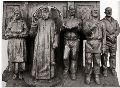
Скульптурная композиция «Русские старообрядцы-некрасовцы» (авторы: Георгий Мясников и Виталий Войчун)