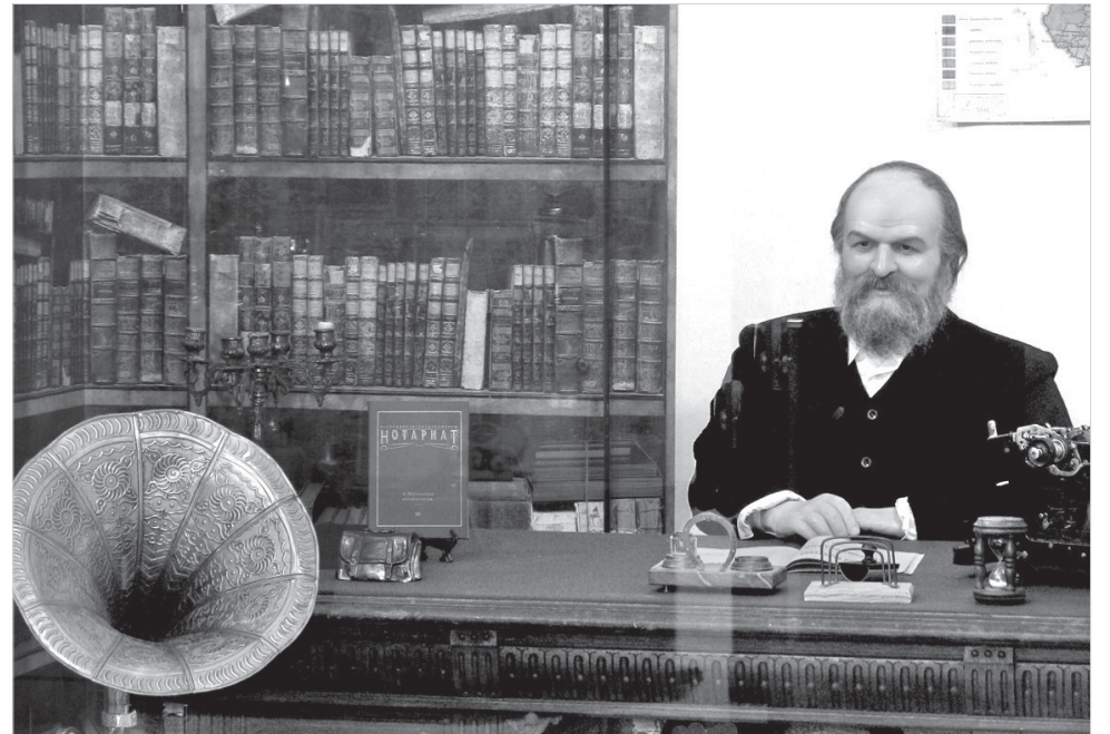
Мемориальный кабинет Г.К. Праве в экспозиции музея истории нотариата Ставрополя.