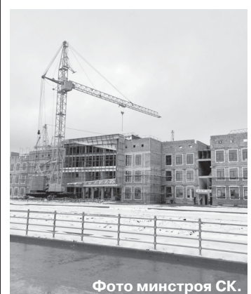
Фото министра СК.

Работы на новом объекте, который возводится на улице Ивана Щипакина, выполнены уже почти наполовину. Здание состоит из четырех функциональных блоков. В одном из них разместятся гардеробные, медпункт, кабинеты администрации, учительская, а также библиотека с читальным залом. Во втором блоке будут учиться начальные классы. Там же разместятся учебные и компьютерные кабинеты, игровые комнаты, помещения группы продленного дня.