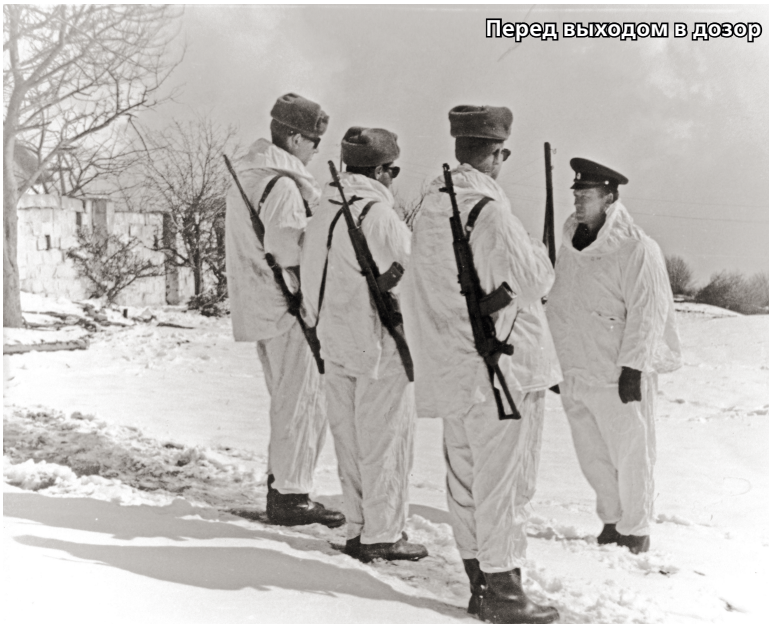
Перед выходом в дозор