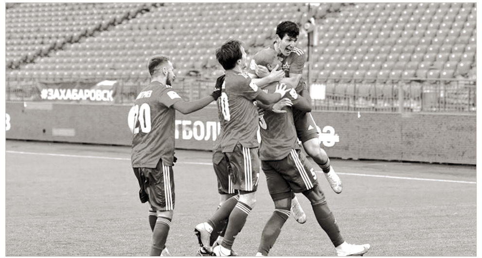
Победа хозяев в Хабаровске в первом стыковом матче