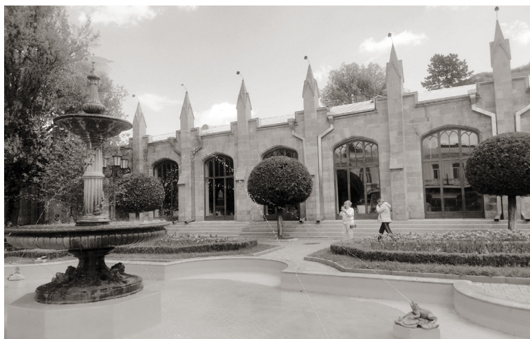
На Ставрополье разработают программу лояльности для туристов