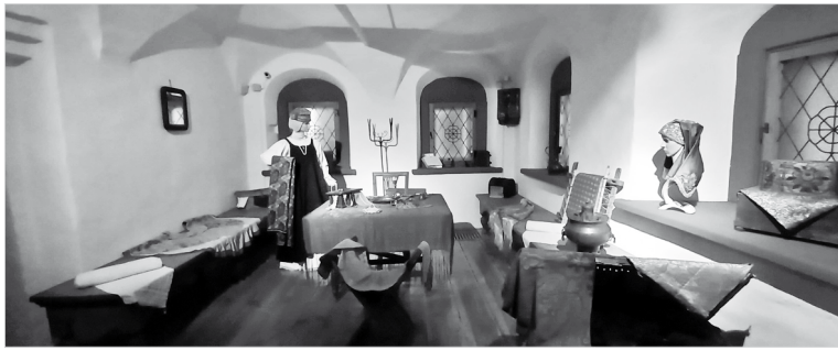
Здесь проводила большую часть времени хозяйка дома