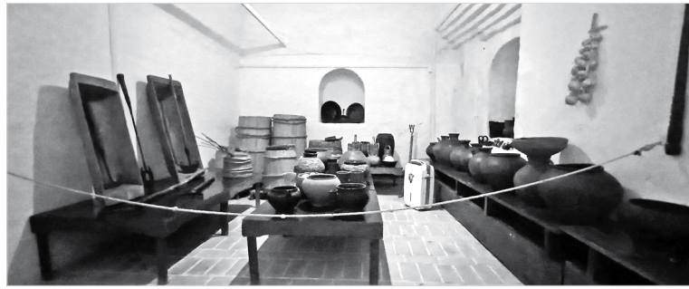
Подклет – «сердце» купеческого дома