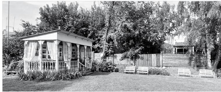
Во дворе расположилась уютная беседка для летних чаепитий