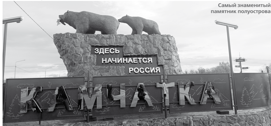
Самый знаменитый памятник полуострова