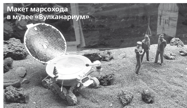
Макет марсохода в музее «Вулканариум»