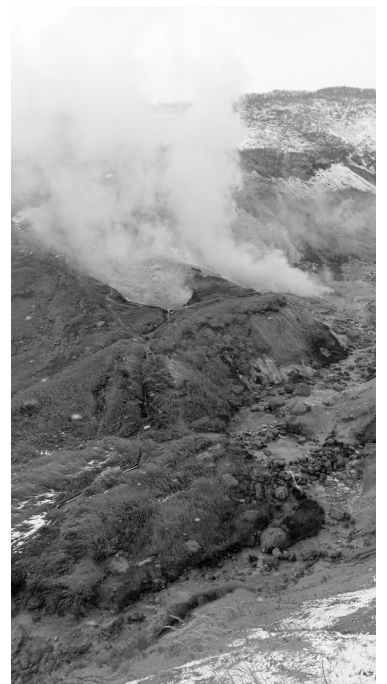
Фумарольные поля близ Мутновской геотермальной электростанции

Конечно, текущей лавы мы не видели. Хотя, как позже рассказали вулканологи в местном музее «Вулканариум», лава – это далеко не самое опасное явление при извержении. Самое страшное – это пирокластический поток – быстро движущаяся (до 700 км/ч) чрезвычайно горячая (~ 1000°C) масса воздуха и различных обломков по-