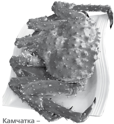
Камчатка – регион морских деликатесов

Неподалеку от аэропорта Елизово в 2011 году установили самый знаменитый на полу-