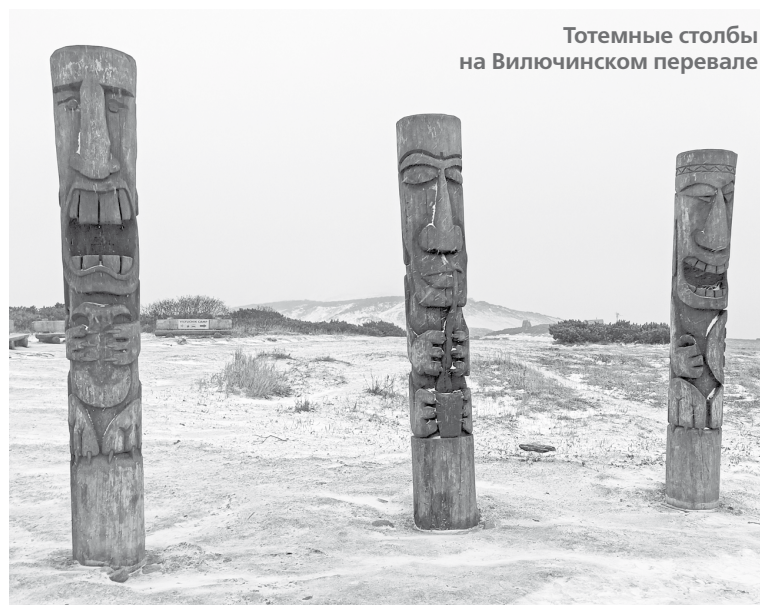
Тотемные столбы на Вилючинском перевале

Как говорят местные жители, гор на Камчатке нет, есть только вулканы и сопки. Честно говоря, разницу нам никто внятно объяснить не смог. Вот, к примеру, одна из версий: сопка – это неболь-