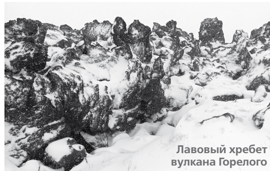
Лавовый хребет вулкана Горелого