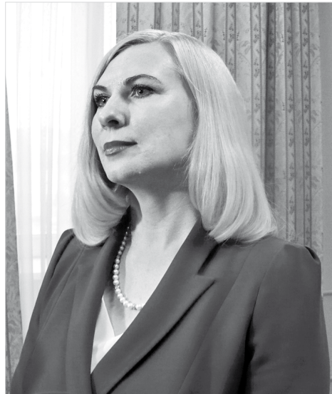
Министр образования края Мария Смагина.

Как отметила Мария Викторовна, в текущем году из бюджетов разных уровней выделены деньги на программу модернизации, в рамках которой производятся капитальный ремонт и оснащение школ современным оборудованием, повышается квалификация педагогов. Реализуется проект «Школа Минпросвещения России» с задачами по формированию единого образовательного пространства и выравнивания возможностей обучающихся разных регионов страны в получении качественного образования.