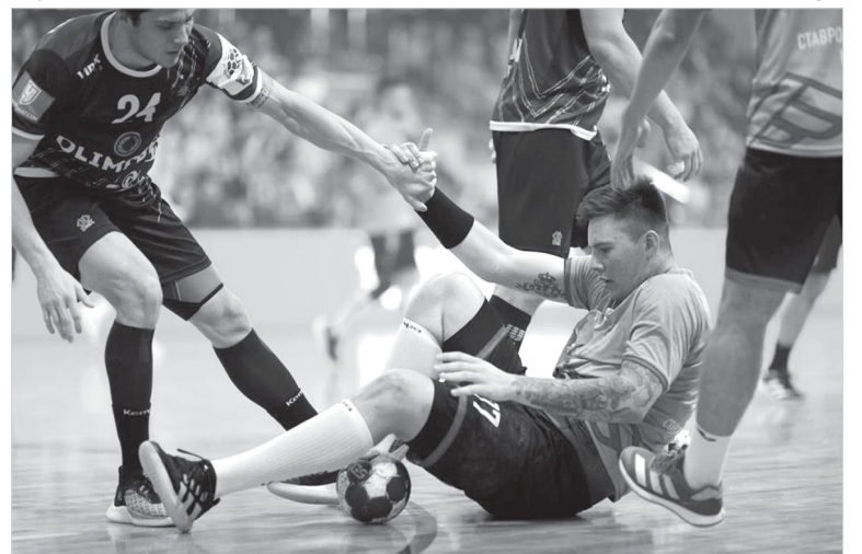
У «Виктора» многое не получалось