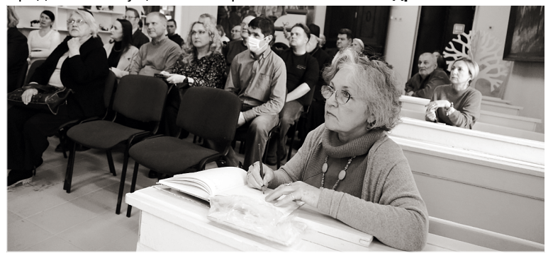
Участники презентации новой книги