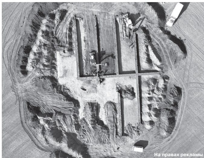
Общая площадь археологических раскопок.

Помимо погребения человека ямной культуры, специалисты обнаружили на месте раскопок еще шесть захоронений более позднего времени. Одни из них свидетельствуют о пребывании на этой территории сарматов (это приблизительно I–III века нашей эры). А самое позднее погребение относится к периоду Большой Ногайской Орды (XVI век нашей эры). Среди находок, обнаруженных археологами, – предметы быта, украшения и оружие: образцы древней посуды, наконечники стрел, бронзовый нож, застежки для одежды и другие артефакты. Через некоторое время всё это можно будет увидеть в музейной экспозиции.