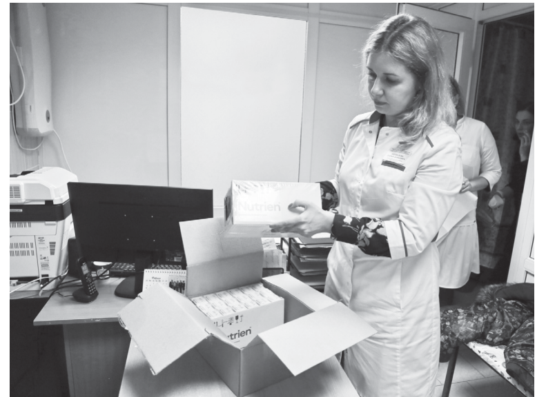
Волонтеры доставили гуманитарную помощь. Многие неравнодушные люди стремятся помочь больным детям