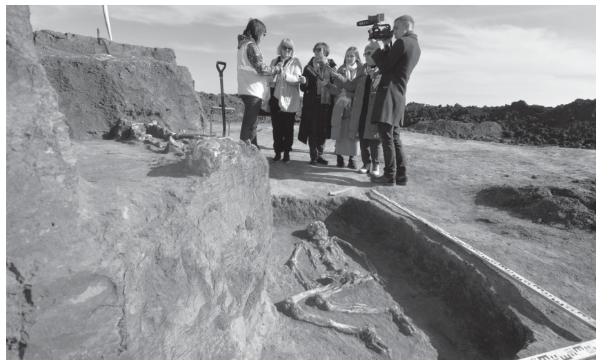
Журналисты региональных СМИ на месте проведения раскопок.