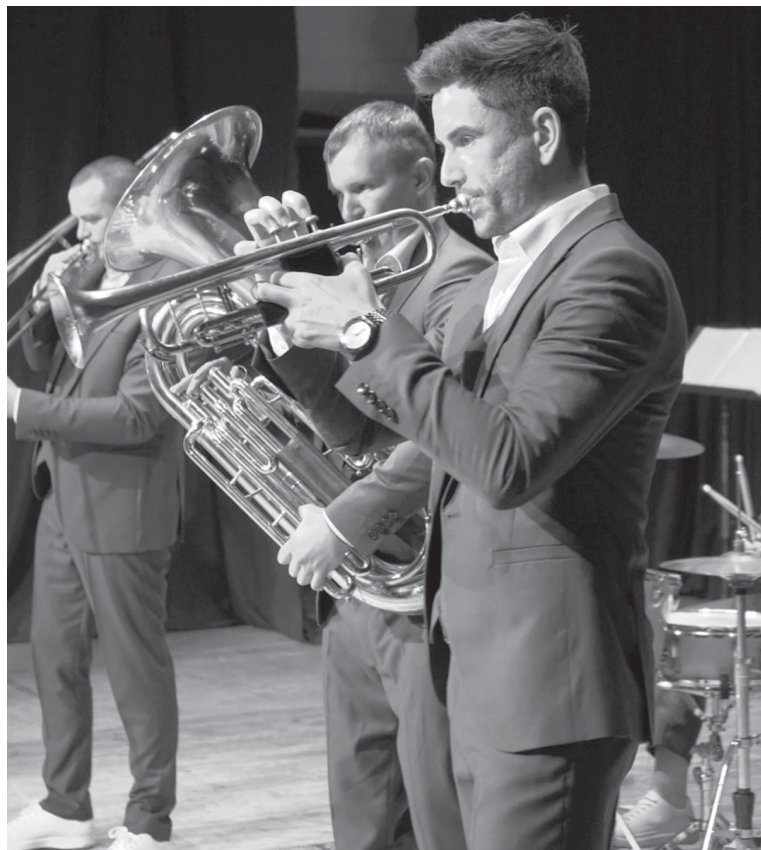
Выступает эстрадный ансамбль духовых инструментов StavLittleBand