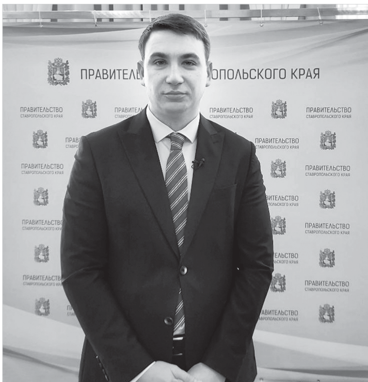
Министр экономического развития Ставропольского края Денис Полюбин

– Тем не менее мы направили запрос в Федеральную антимонопольную службу по вопросу роста цен на плодоовощную продукцию. В ответе ведомства сообщается, что оснований для принятия мер антимонопольного реагирования в части увеличения розничных цен на плодоовощную продукцию нет, так как в крае отсутствуют хозяйствующие субъекты, занимающие доминирующее положение на рассматриваемом рынке, и отсутствует ценовой сговор между продавцами, – отметил глава министерства.