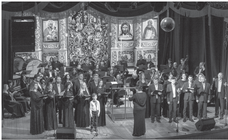
Камерный хор Ставропольской филармонии

Вся вокальная музыка композитора отличается искренностью высказывания, великолепием гармонии, неповторимыми, завораживающими рахманиновскими мелодиями. Исполнять романсы последнего русского романтика мечтают все вокалисты, так же как и пианисты мечтают исполнить его фортепианные произведения. Наряду с романсами украшением вечера станут хоровые сочинения. Эта область творчества Рахманинова связана с глубинными, исконно русскими традициями хорового пения, которые неизменно приводили в восхищение слушателей России и крупнейших концертных залов мира. В Ставрополе эта часть рахманиновского наследия звучит редко: партитуры чаще всего рассчитаны на хоры большого состава и требуют от артистов огромной отдачи и профессионализма, но усилия стоят того: даже хоровые миниатюры композитора заставляют замывать от их удивительной красоты, величия и обладают той неисчислимой силой эмоционального воздействия, которая всегда отличала творения великих мастеров. Среди премьер, которые готовят артисты к юбилейному вечеру, концерт для хора «В молитвах не усыпающую