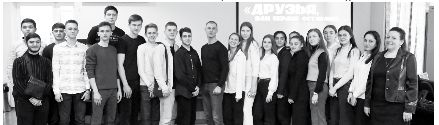
Фотография на память со студентами Российской академии народного хозяйства и государственной службы

...Живи, мой братец, всем смертям назло. Со временем затянутся все раны. И знай, тебе не просто повезло – У Бога на тебя другие планы.