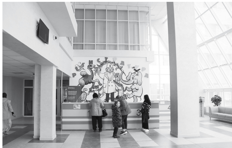
В детской поликлинике клинического многопрофильного центра

двигала идею возведения новой поликлиники. Лично контролировал строительство на всех его этапах губернатор Ставропольского края Владимир Владимиров.