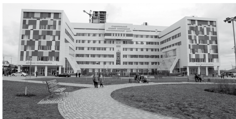
Краевой клинический многопрофильный центр на улице Тюльпановой