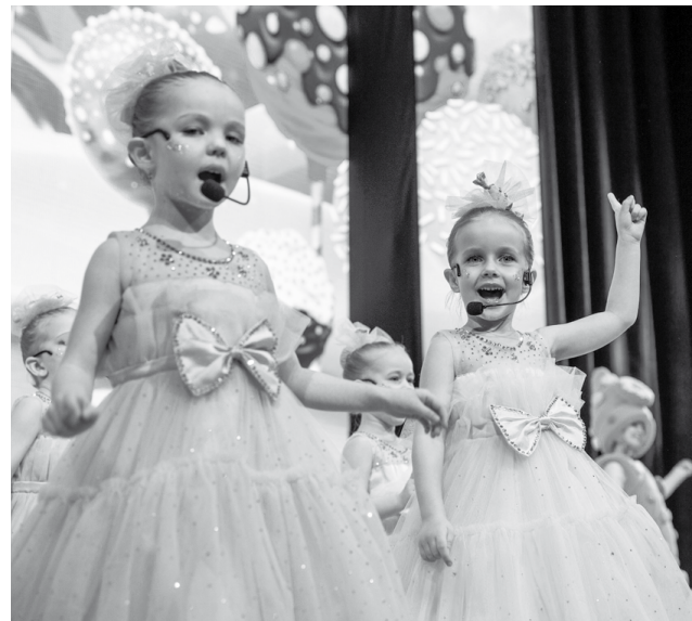
Собравшихся радовали выступления творческих коллективов города