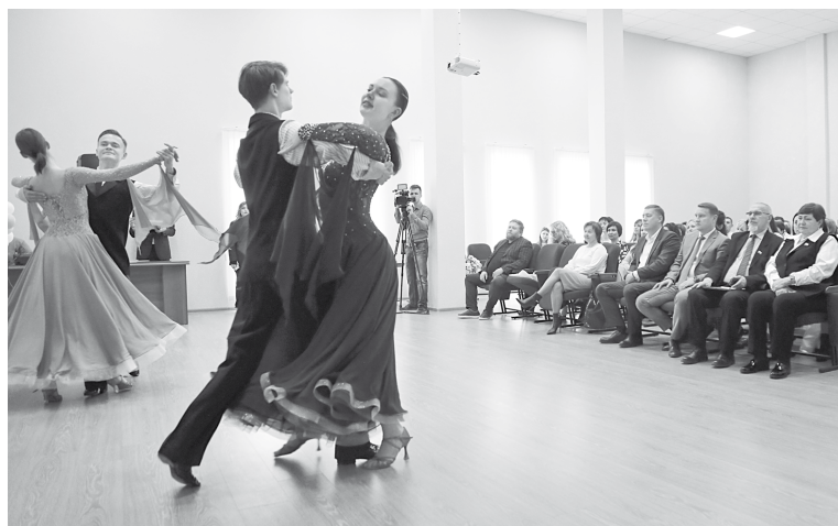
Творческие коллективы города подготовили для медиков концертную программу

Вспоминая о том времени, когда решался вопрос о будущем строительстве, многие из присутствующих с благодарностью говорили о деятельном участии депутата Государственной Думы РФ Ольги Тимофеевой, которая с самого начала настойчиво про-