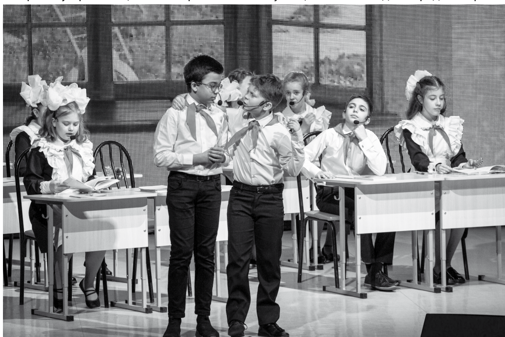
Праздник открылся театрализованной постановкой

Пришло время традиционных ценностей, сегодня все осознают, что в руках учителей, педагогов, наставников находится будущее нашей страны, умы и сердца подрастающего поколения. Настало время по-новому учить, вдохновлять, развивать могучую Россию. В связи с этим председатель комитета Госдумы по развитию гражданского общества, вопросам общественных и религиозных объединений Ольга Тимофеева обратилась с большой просьбой к землякам – воспитывать настоящих патриотов города, Ставропольского края и в целом великой страны – России. Лучшими педагогами-наставниками она назвала каждого педработника, обратившись к ним онлайн: «Дорогие наши, любимые учителя, воспитатели, наставники! Я была во всех школах нашего города и знаю состояние дел в каждой. Нам очень важно, чтобы у вас горели глаза, чтобы вы, заходя в класс, в школу, думали не о проблемах, а о том, что вы учите и воспитываете детей. Это важно как никогда. Низкий поклон вам за вашу работу, за то, что делаете каждый день. Низкий поклон тем педагогам, чьи воспитанники сегодня находятся на передовой».