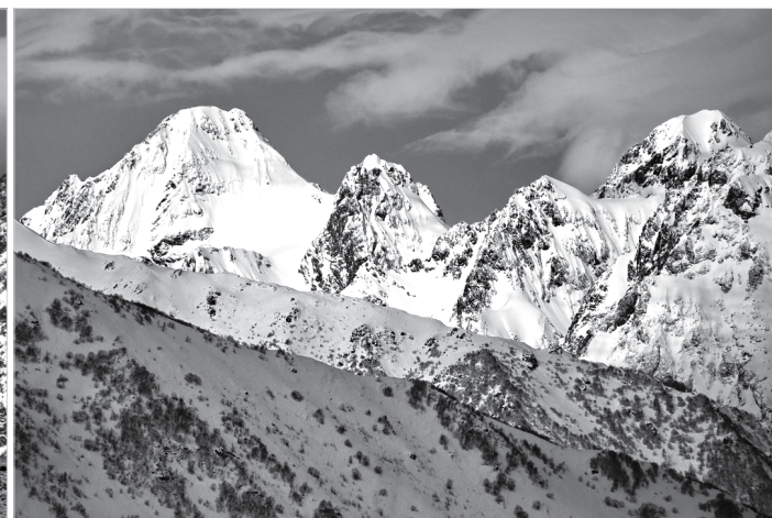
Вершины Адайхох, Кальтберг и Мамисонхох (объектив 500 мм)