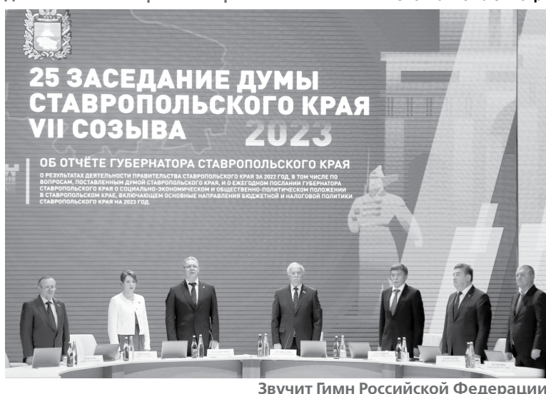
Звучит Гимн Российской Федерации