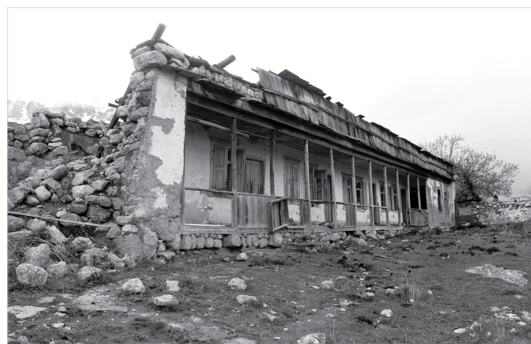
Предположительно здание школы