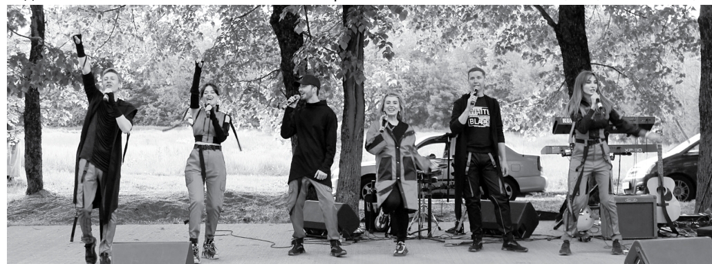
Первый летний концерт под открытым небом в Ботаническом саду