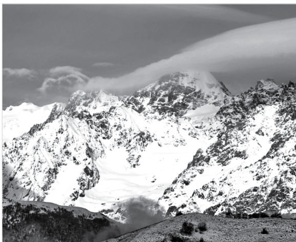
Вершина Уилпата скрыта облаком