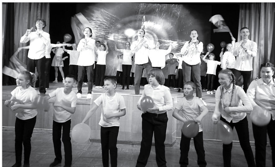
Финал юбилейного концерта