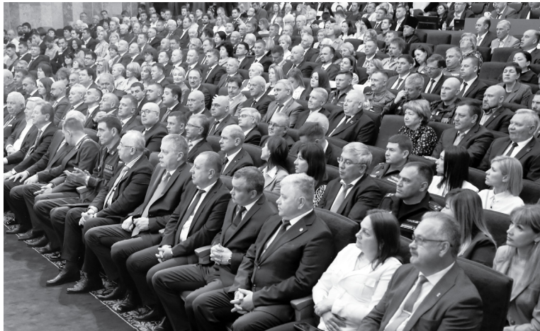
Отчет главы региона слушали с большим вниманием

Тем более что талантливых детей у нас немало. За прошлый год почти 500 ставропольских школьников стали победителями и призерами регионального