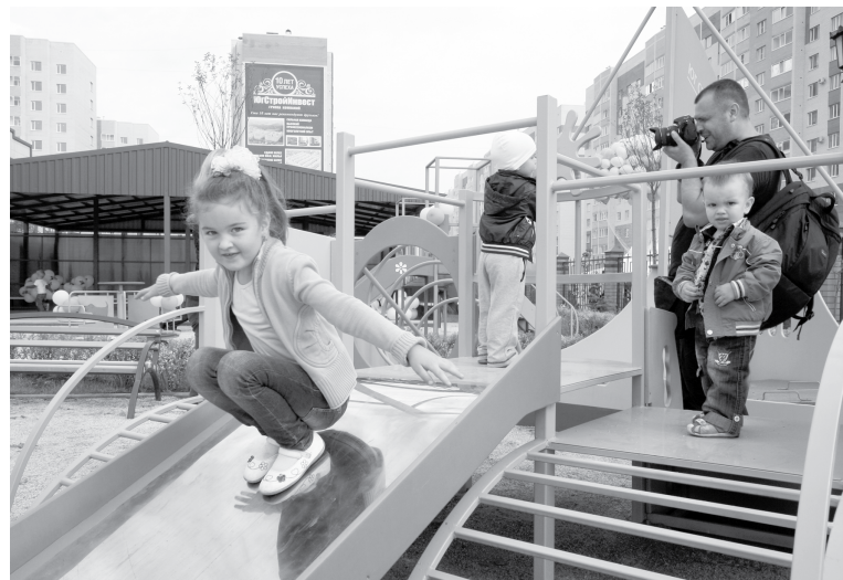
В крае создадут реестр площадок, требующих ремонта