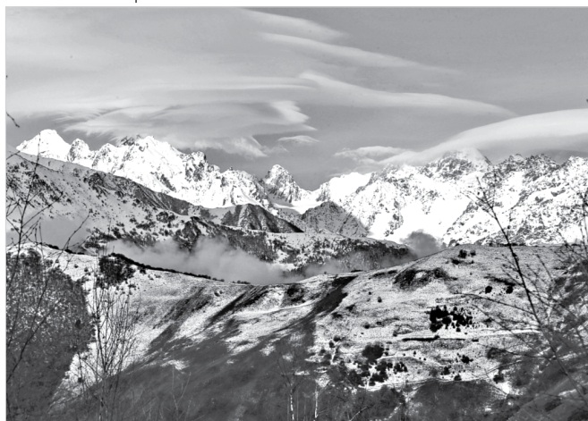
Вершины Цейского района под линзообразными облаками