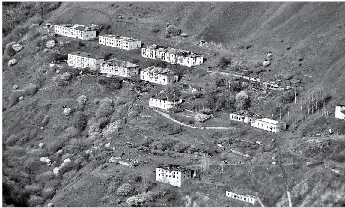
Рабочий посёлок советской постройки