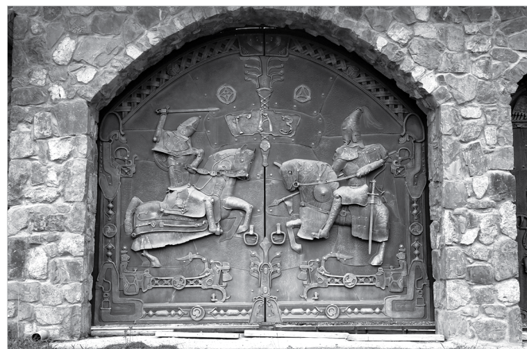
Ворота музея Гаджиновых