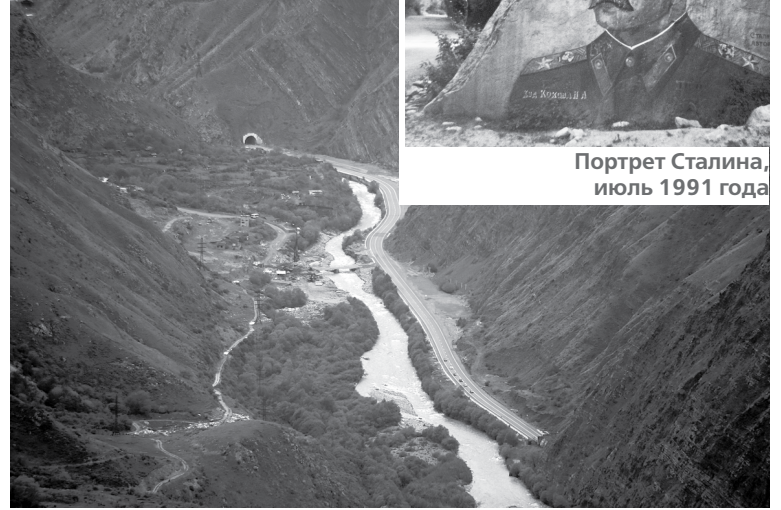
Дорога в Алагирском ущелье идёт через тоннели