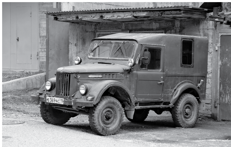
Рабочий ГАЗ-69 в посёлке Мизур