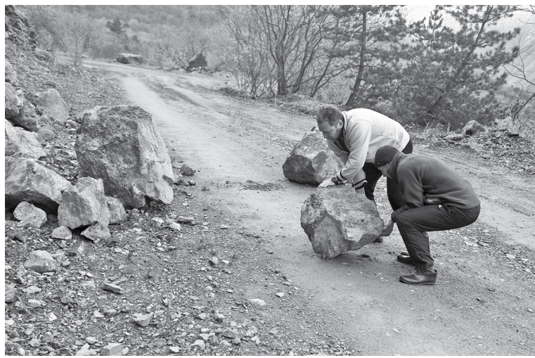
Убираем камни с дороги

Я знаю, что дальше дорога пойдёт траверсом в ущелье, почти ровно, и уже предчувствую встречу с Цеем, в котором не был с 1991 года. На информационной табличке написано, что можно увидеть в ущелье. Но больше всего меня поражает само название. Я привык к тому, что это просто Цей, три буквы, слово легко прочитать. Здесь же написано по-осетински. Я не понимаю, как произносятся эти