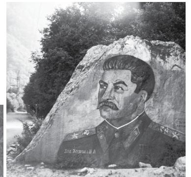
Портрет Сталина, июль 1991 года

звучи. Надо бы спросить кого-нибудь из местных.