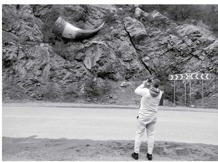
Рог изобилия над дорогой