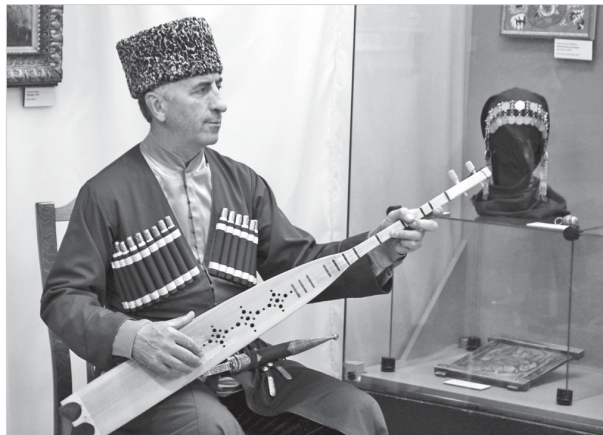
В музее звучали песни на стихи Расула Гамзатова

Юлия КАЛМЫКОВА.