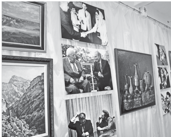
В экспозиции представлены фото и художественные работы