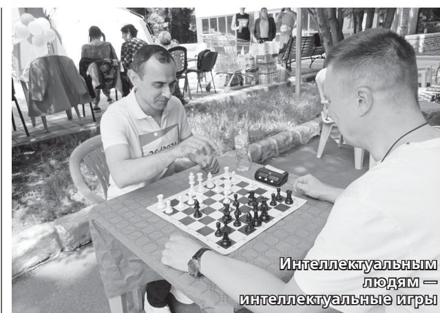
Интеллектуальным людям интеллектуальные игры