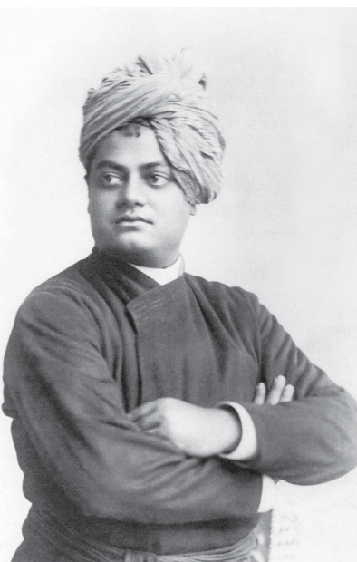
Свами Вивекананда https://ru.wikipedia.org/wiki/Вивекананда

Вся сложность нашей жизни в том, что душа противопоставляет негативу свои качества, основанные на любви, и цель ее – противоположная реакция тела и ума, поднимать свой уровень силы Духа, тем самым снижая недобрую активность своих оппонентов. Это наисложнейшая задача, на решение которой требуется множество жизней в новых телах.