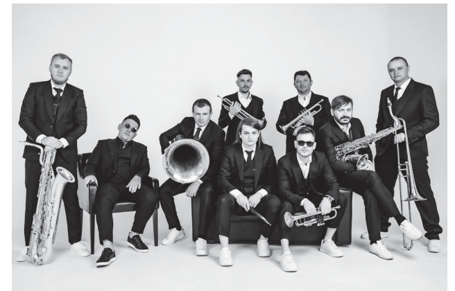
Ансамбль духовых инструментов StavLittleBand

Рахманиновская рапсодия на тему Паганини – детище двух гениев исполнительского мастерства. Каприсы италянца Никколо Паганини совершили переворот в скрипичном языке и выразительности. Последний, самый популярный 24-й каприз – поистине уникален. Критики и сегодня осыпают его самыми восторженными эпитетами: «Каким надо быть гением, чтобы такое написать, и каким