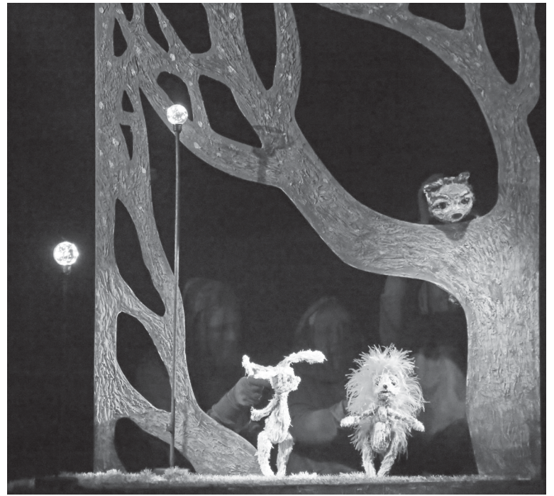
Сцена из спектакля «Ёжик в тумане и другие истории»

зрителем заглянуть в загадочный мир, где «нереальные» герои живут и чувствуют так по-настоящему.