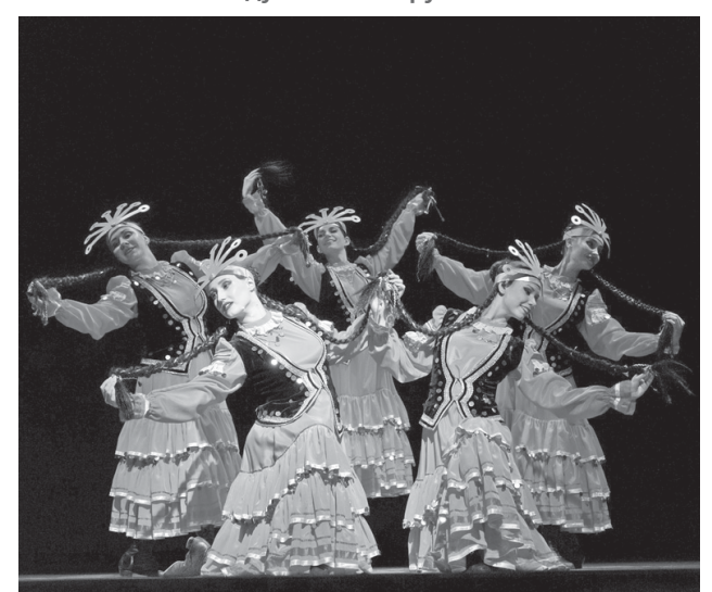
«Ах, карнавал!» – увлекательное музыкальное путешествие по странам и континентам