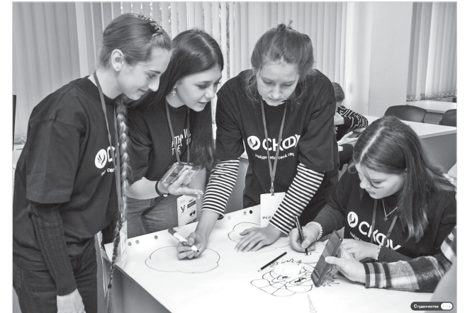
Фото Форума абитуриентов «Beta-версия студенчества»

На заключительном этапе проекта прошли экскурсии на предприятия края. Здесь ребята смогли познакомиться со спецификой различных профессий.