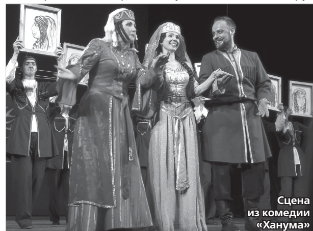
Сцена из комедии «Ханума»