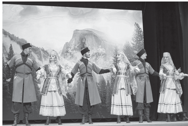
На сцене – ансамбль «Слобода»