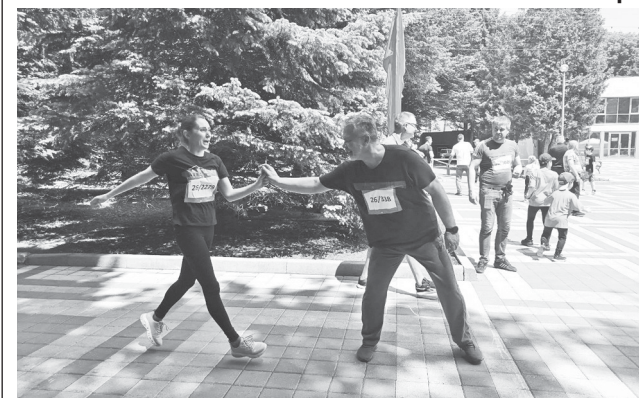
Адвокат должен быть всегда в хорошей форме