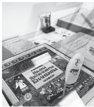
Выставка «О Пушкине, о книге, о любви...» – разнообразие произведений Александра Сергеевича, изданных в разные годы