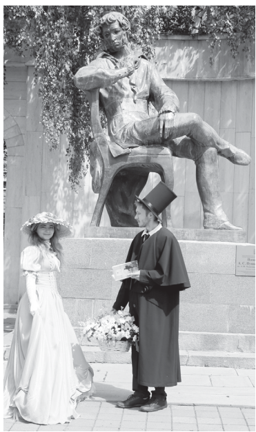
Цветы – любимому поэту

А ближе к вечеру пушкинский праздник продолжился на Александровской площади. Для гостей работали летний читальный зал под открытым небом и фотозона «Лукоморье-2023», к микрофону выходили ценители