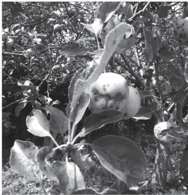
Диагноз «больного» – парша

От мучнистой росы дачники обычно защищают огурцы и другие тыквенные культуры, но белый налет на листьях можно встретить и на яблоне, репе – на груше. Инфекция в виде белого налета на листьях (она обычно начинается с нижних веток, расположенных ближе к земле) может выступить весной при долгой дождливой прохладной погоде. Грибком поражаются также молодые побеги, черешки, плодоножки и завязи. Через некоторое время после созревания спор появляются капли жидкости, поэтому болезнь и назвали мучнистой росой. Если не принимать мер к уничтожению и пресечению распространения гриб-