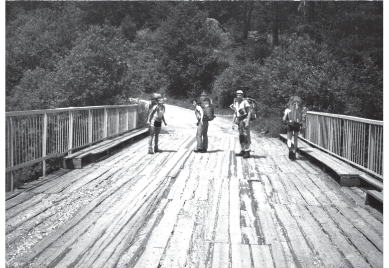
Мост. Верхний снимок 2023 год. Нижний – 1991-й

решают посмотреть на «графские развалины».