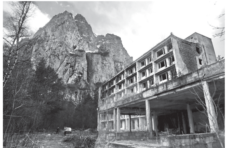
Остов гостиницы «Горянка»