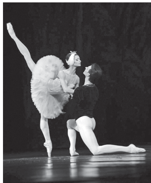
Хорошая традиция – открывать форум творческих союзов балетом