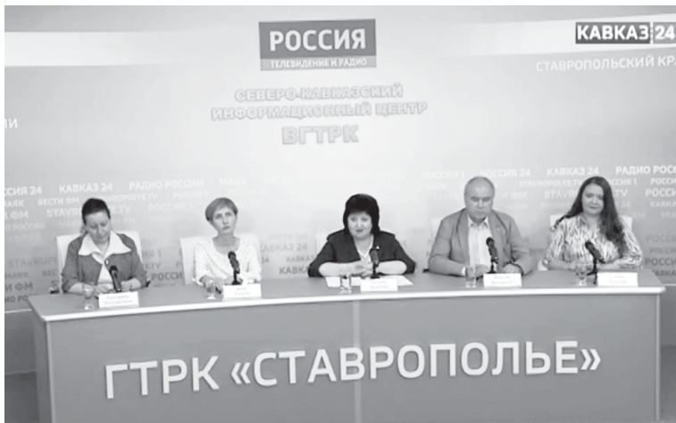
Участники пресс-конференции в информационном центре ГТРК «Ставрополье» (кадр трансляции на stavropolye.tv)