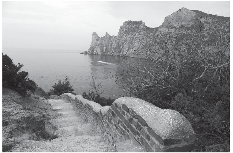
Тропа в Сквозной грот, Царская бухта и скала Сторожевая

Девушка-фотограф строит свою группу для общего снимка: «Ребята, посмотрите на меня, у меня сегодня день рождения!» Не люблю фотографировать большие группы, трудно добиться от людей нуж-