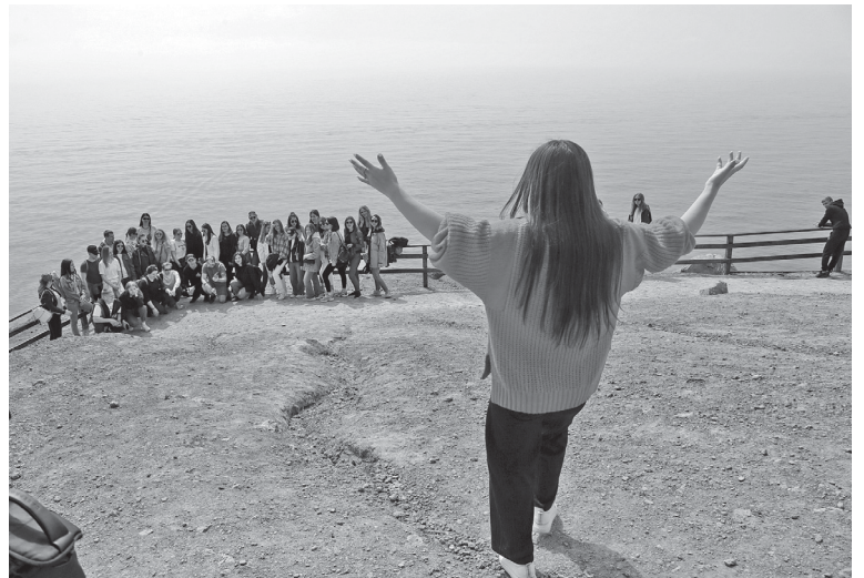
Девушка-фотограф пытается привлечь внимание толпы