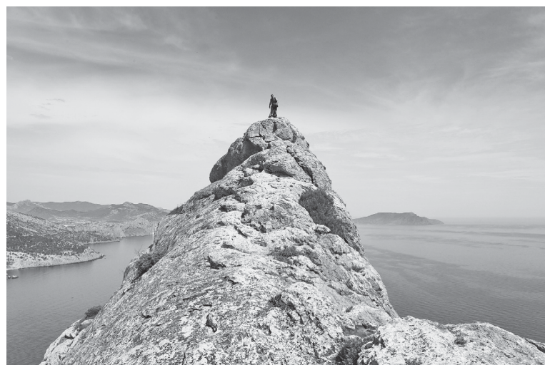
Вершина горы Коба-Кая