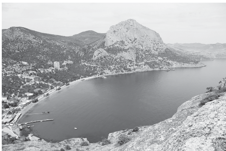
Бухта Нового Света и гора Сокол