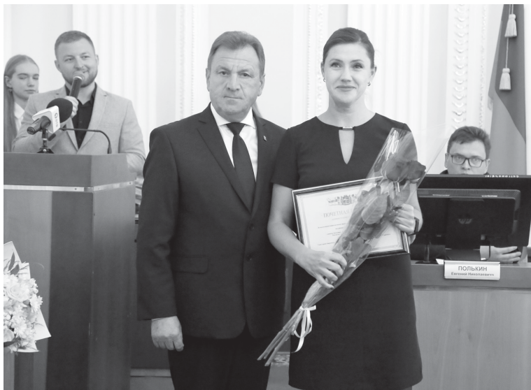
Награждение работников торговли