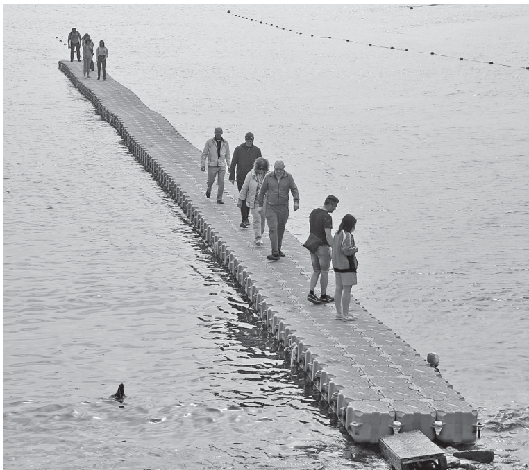
Тротуар понтонного типа в бухте Нового Света

Есть в этом и положительный момент. Все вышеперечисленные товарищи так или иначе попадают в кадр и, находясь рядом со мной, получают довольно много снимков. Обычно, видя себя на фото, они рассказывают, как я круто фотографирую, что всегда вызывает у меня лёгкую усмешку. Потому что, как только появляется фото без них, они тут же теряют интерес, и взгляд их тускнеет. За этим процессом забавно наблюдать — такова человеческая природа. Прежде всего, мы уделяем внимание себе, и только позже оглядываемся и замечаем вокруг кого-то или что-то ещё.